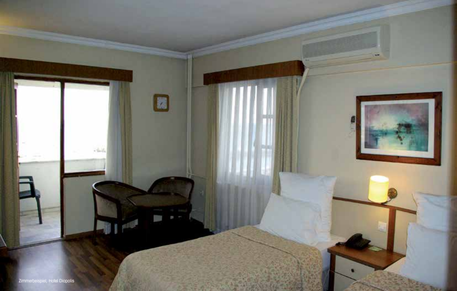
Zimmerbeispiel, Hotel Diapolis