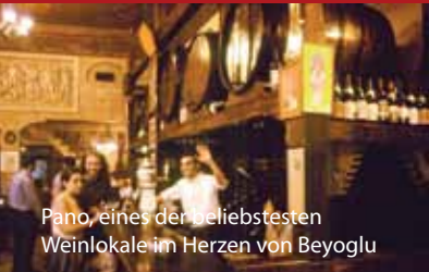
Pano, eines der beliebtesten Weinlokale im Herzen von Beyoglu