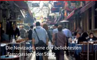
Die Nevizade, eine der beliebtesten „Fressgassen“ der Stadt