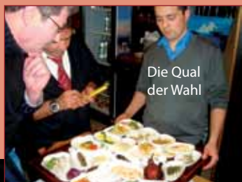
Die Qual der Wahl

Als separate Tour inklusive des kompletten Dinners E 95,-