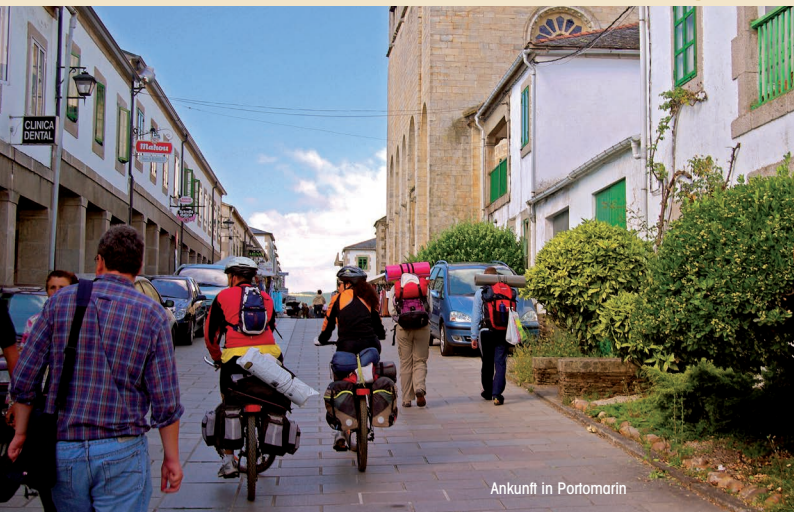
Ankunft in Portomarín