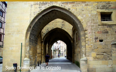
Santo Domingo de la Calzada