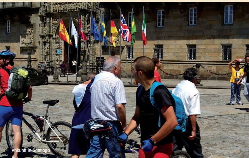
Ankunft in Santiago