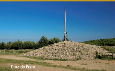
Cruz de Ferro