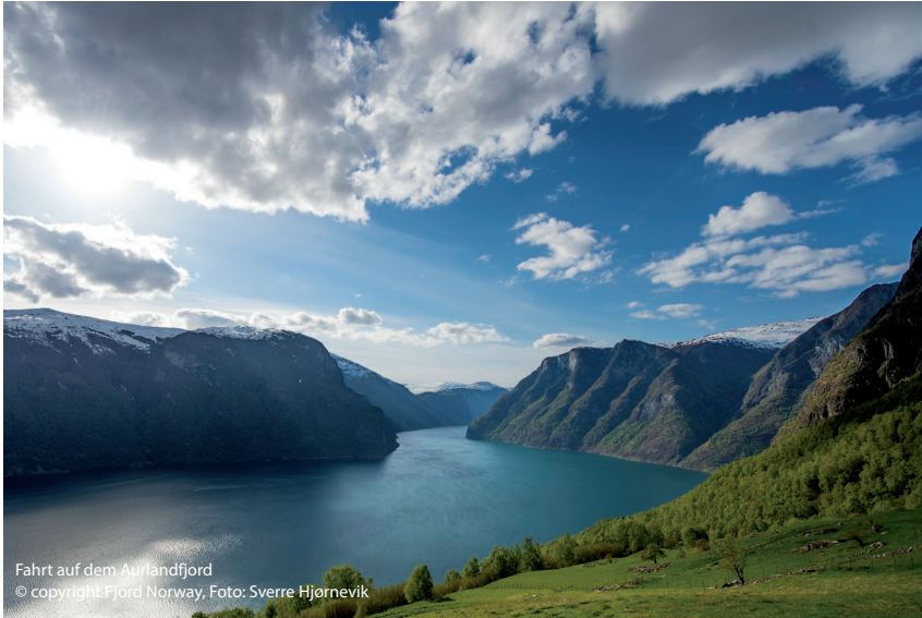
Fahrt auf dem Aurlandfjord