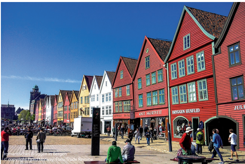
romantisches Bryggen in Bergen