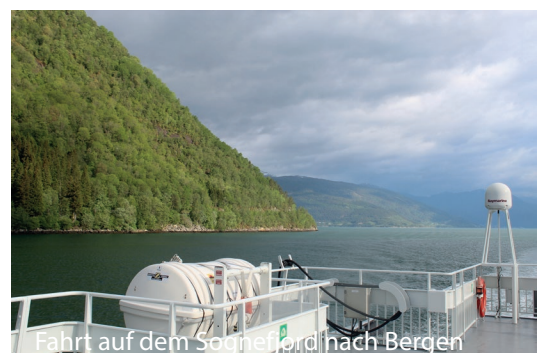
Fahrt auf dem Sognefjord nach Bergen