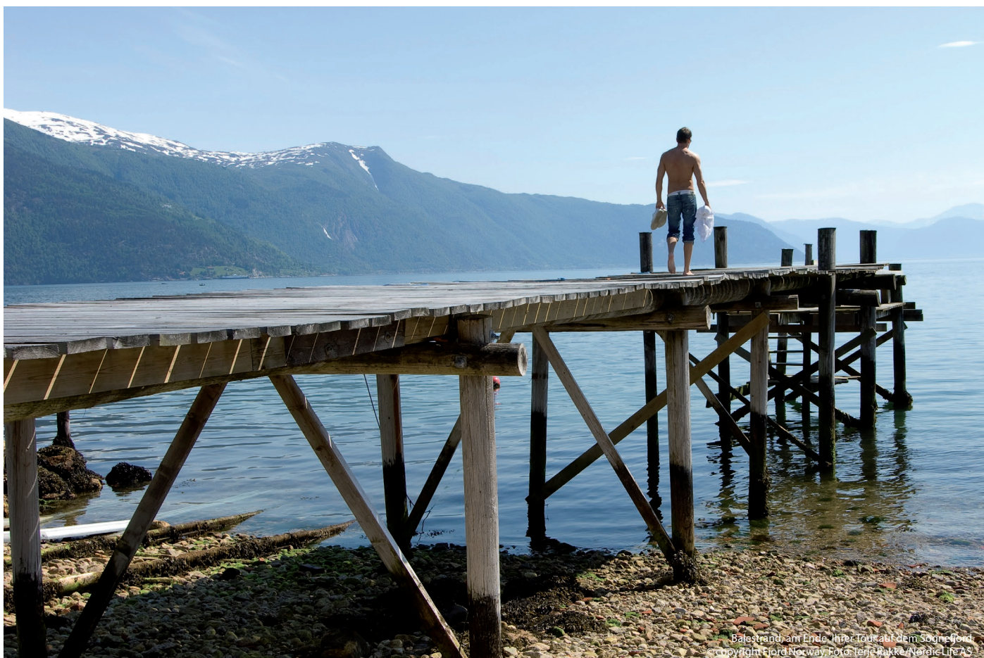
Balestrand am Ende Ihrer Tour auf dem Sognefjord