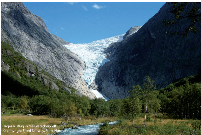
Tagesausflug in die Gletscherwelt