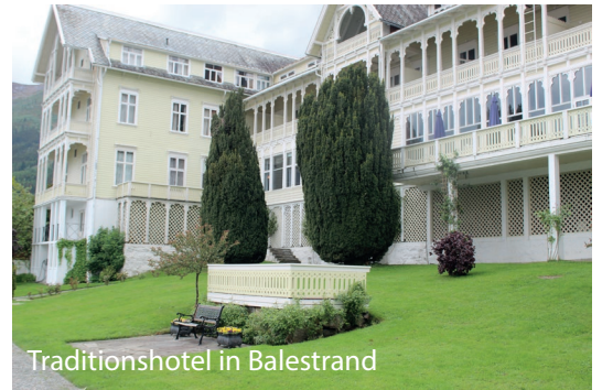
Traditionshotel in Balestrand