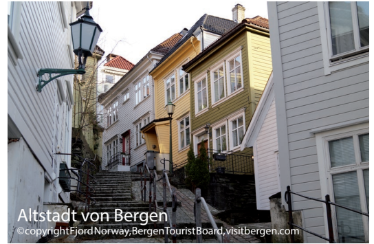
Altstadt von Bergen