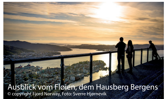
Ausblick vom Fløien, dem Hausberg Bergens