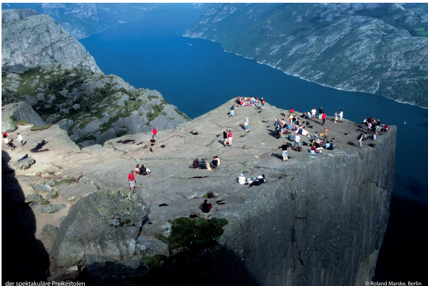
der spektakuläre Preikestolen