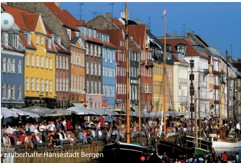
zauberhafte Hansestadt Bergen