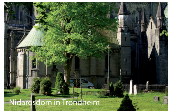
Nidarosdom in Trondheim