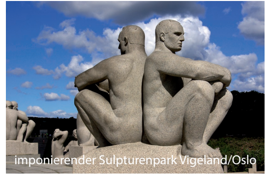
imponierender Sulpturenpark Vigeland/Oslo