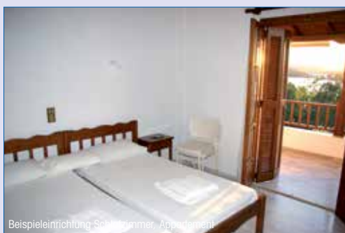
Beispielinrichtung Schlafzimmer, Apartment