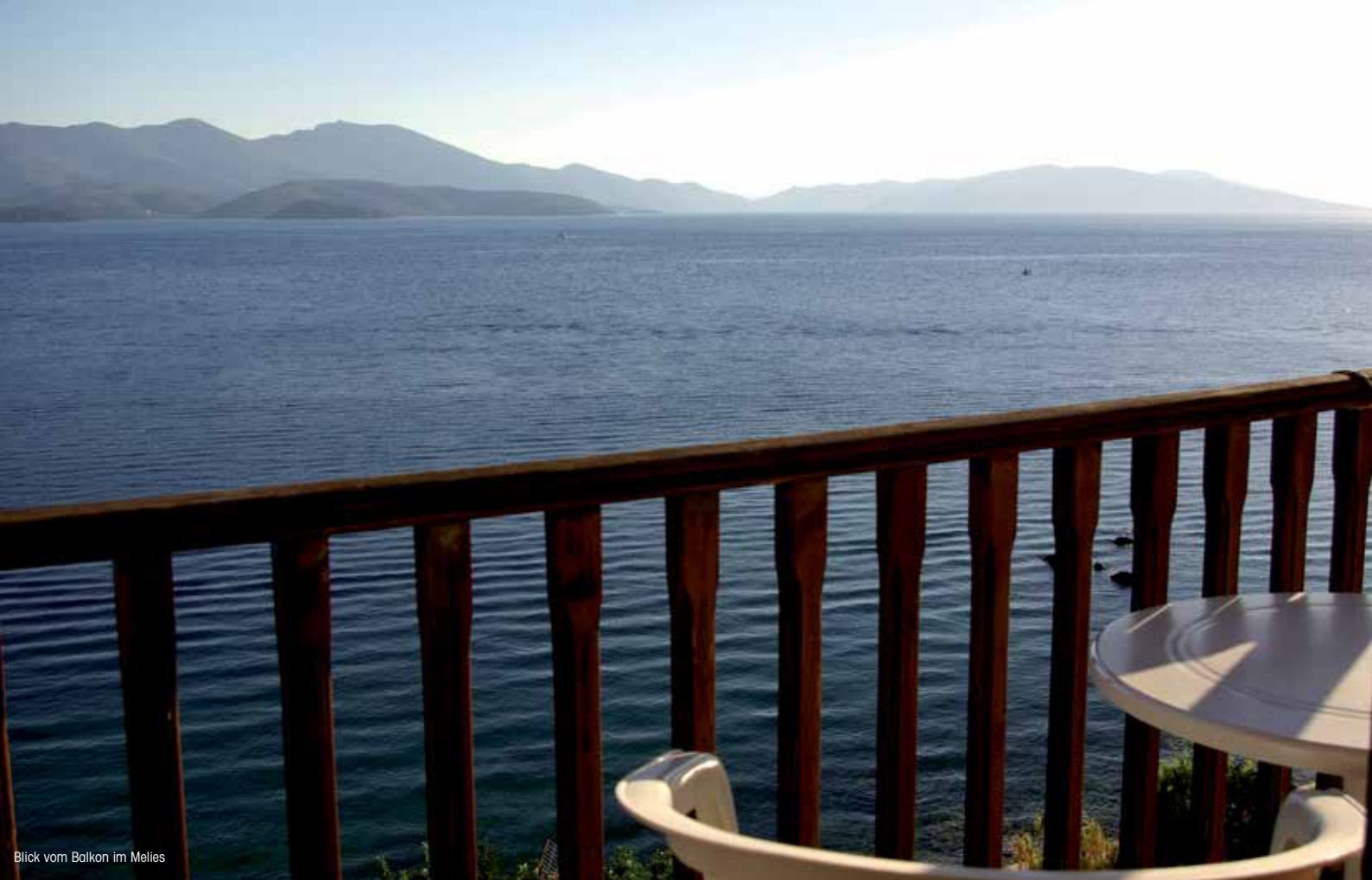
Blick vom Balkon im Melies