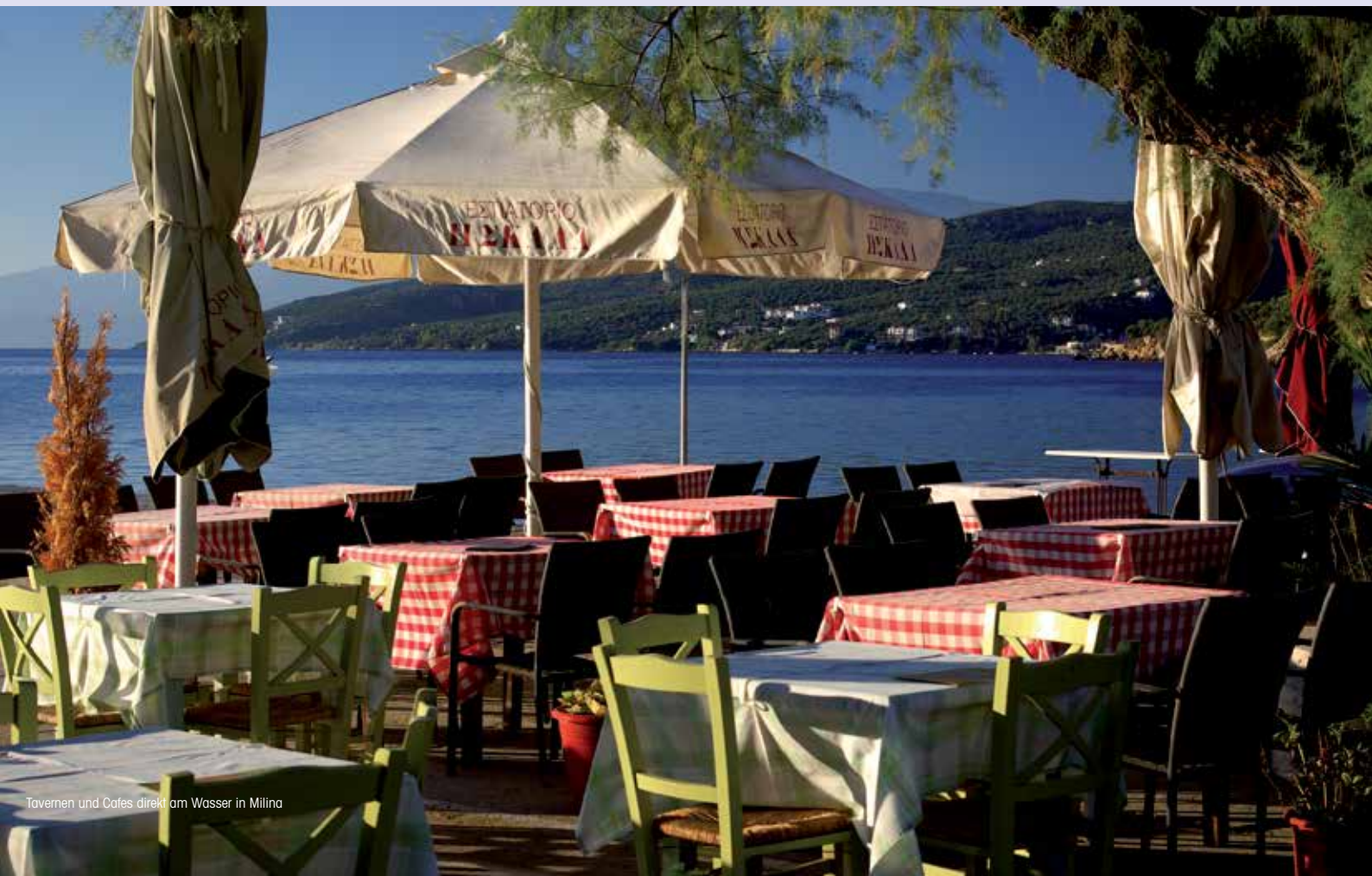
Tavernen und Cafes direkt am Wasser in Milina

Horto und Milina sind zwei kleine, quirlige Küstenorte im Südwesten der Pilionhalbinsel. Hier geht es noch typisch griechisch zu, nette Tavernen, Bars und Cafes säumen die Uferpromenade.