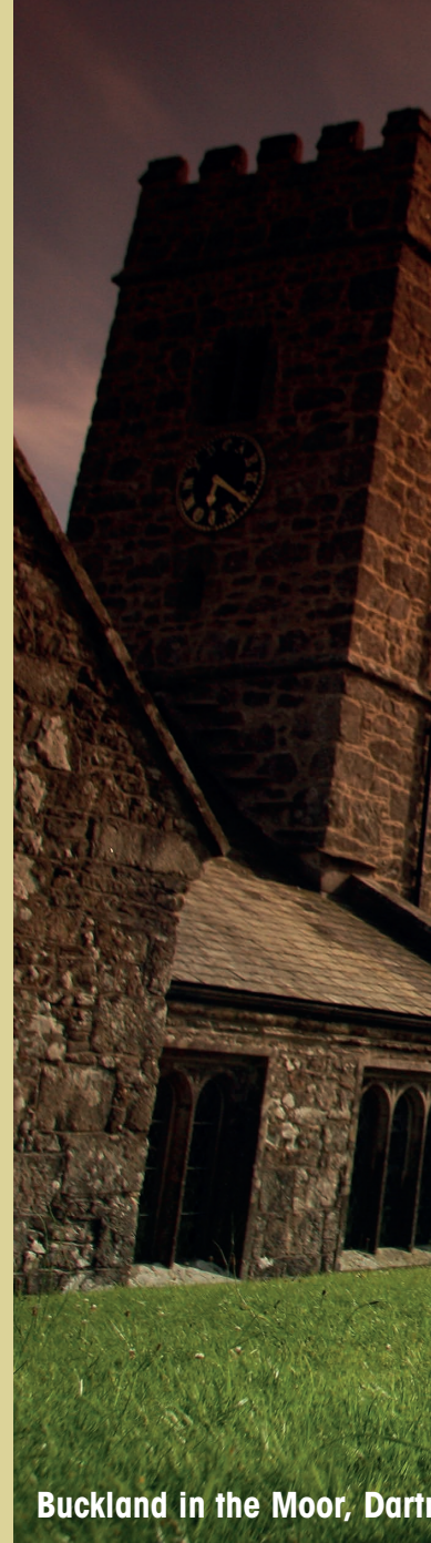
Buckland in the Moor, Dartmoor

Das ganze Gegenteil dieser düsteren, grandiosen Landschaft erleben Sie dann in den idyllischen Küstenstädten und Urlaubsorten, wie z.B. Torquay mit fast mediterranem Urlaubsflair an der Englischen Riviera! Eine wunderschöne Landschaft und ein mildes Klima mit herrlichen Stränden, bilden ein ganz besonders schönen Teil Südenglands. Hier gibt es auch Tradition und Nostalgie pur. So z.B. auf einer Fahrt in einem historischen Dampfzug entlang der Küste. Ein herrlicher, erlebnisreicher Ausflug, der z.B. Teil unseres Programms „Cornwall auf Schienen“ oder als Tagesausflug auf einer unserer Autorundreisen ist.