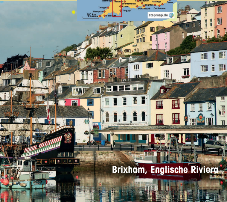
Brixham, Englische Riviera