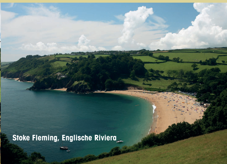
Stoke Fleming, Englische Riviera